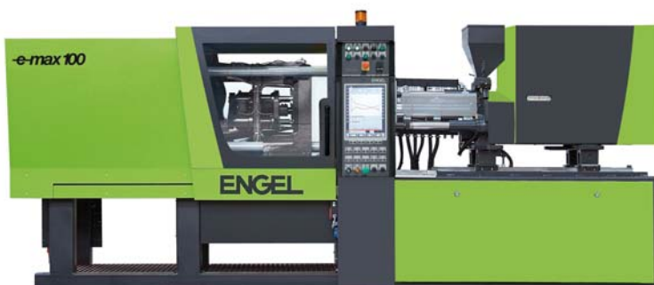
Die neu entwickelte kompakte, vollelektrische Maschine ENGEL e-max 100 mit hoher Performance und besonders günstigem Preis-Leistungs-Verhältnis