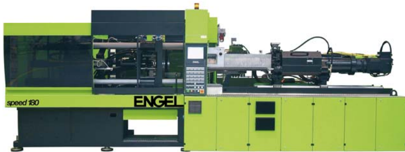
ENGEL speed 180/55 mit 1.800 kN Schließkraft zur Produktion von Rundbechern